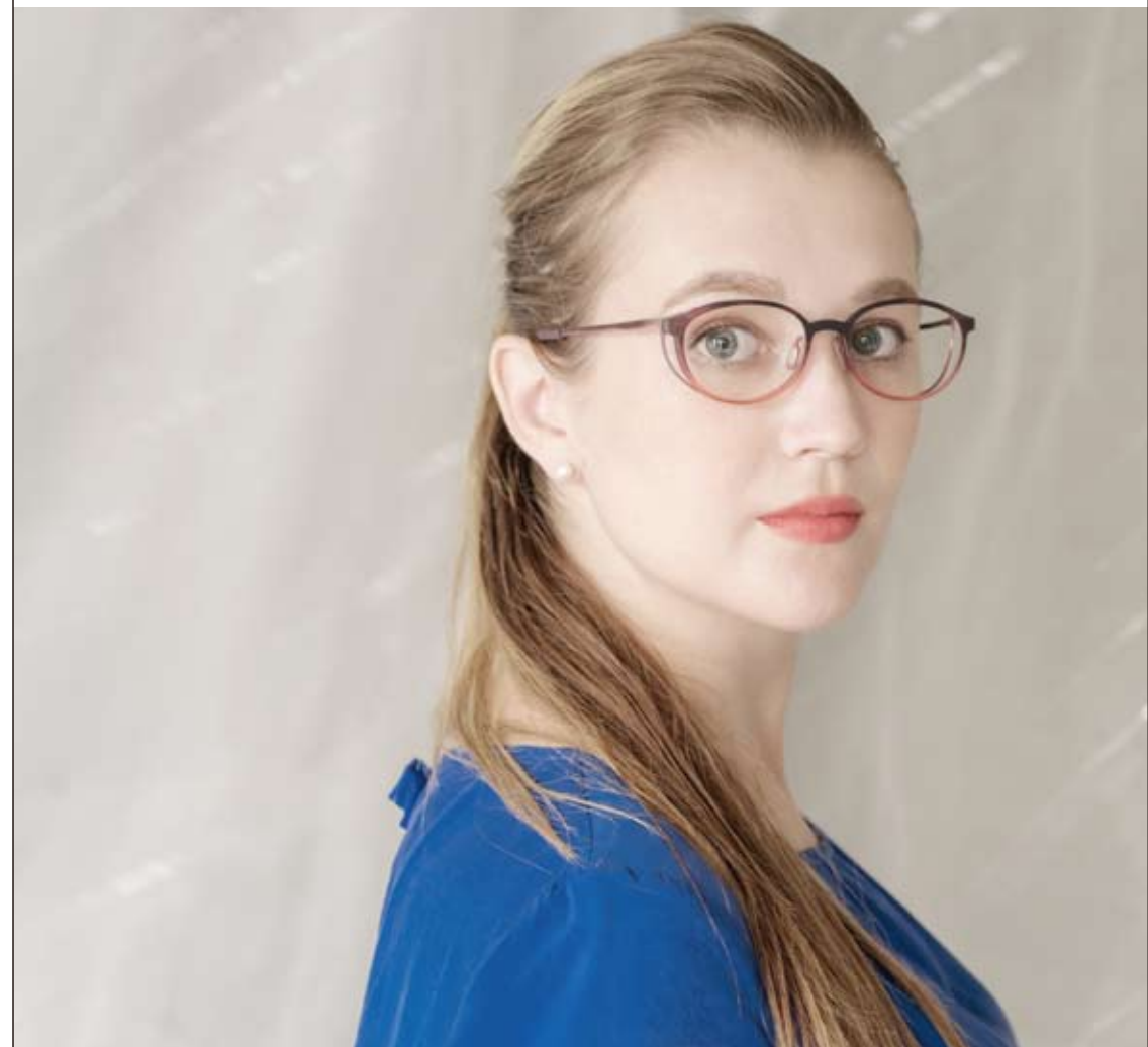
ES-1772 05 purple sasa-red/red