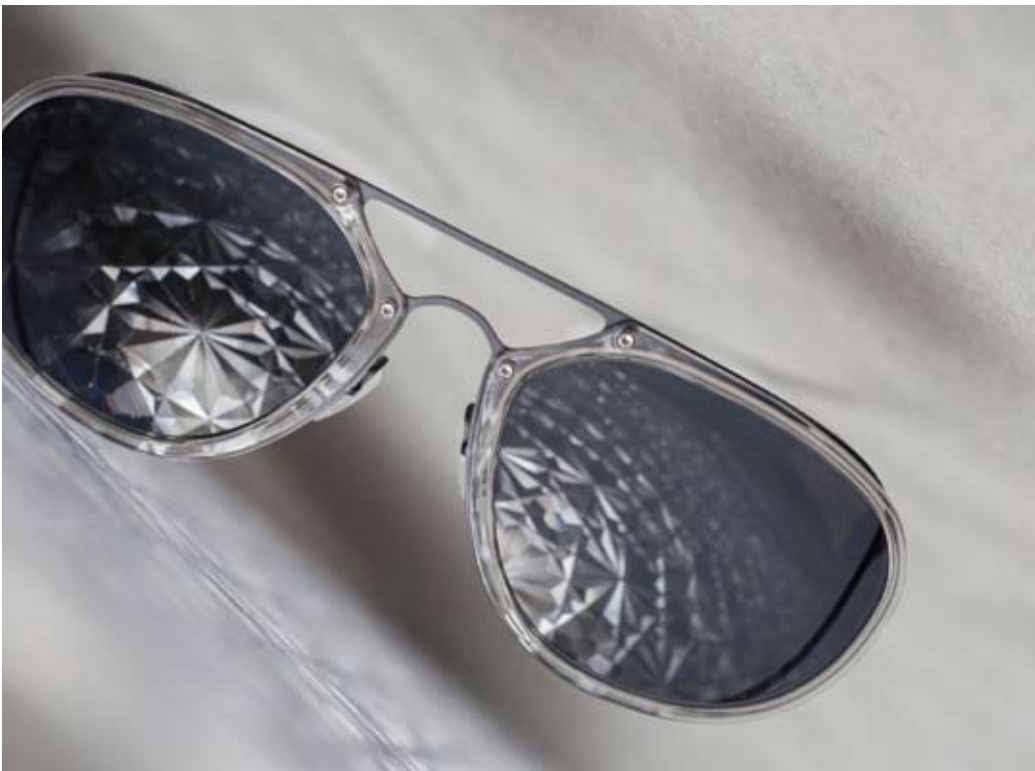
ES-1793 02 clear gray/white