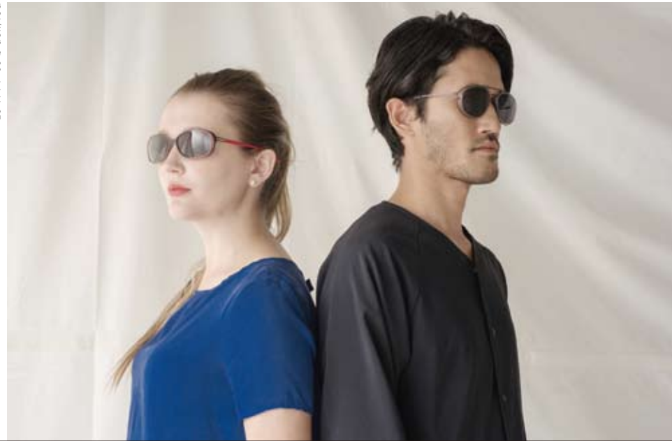
ES-1794 03 black/red