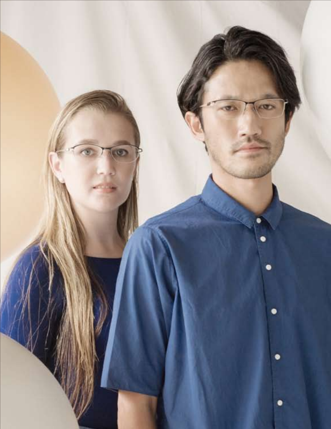
ES-1763 04 deep blue/gray/white